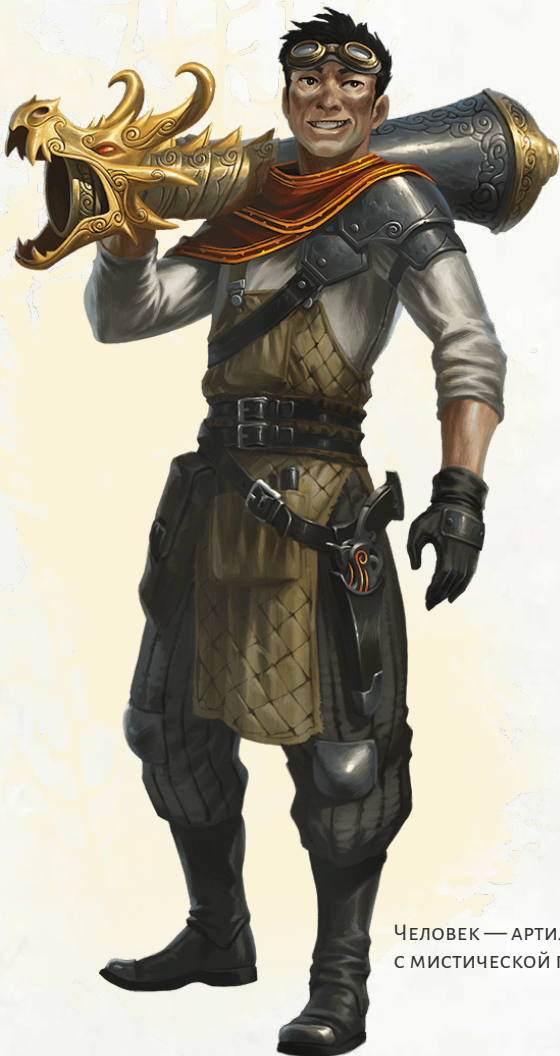
ЧЕЛОВЕК — АРТИЛЛЕРИСТ С МИСТИЧЕСКОЙ ПУШКОЙ