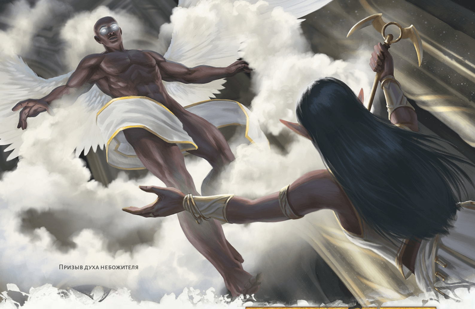
Призыв духа небожителя