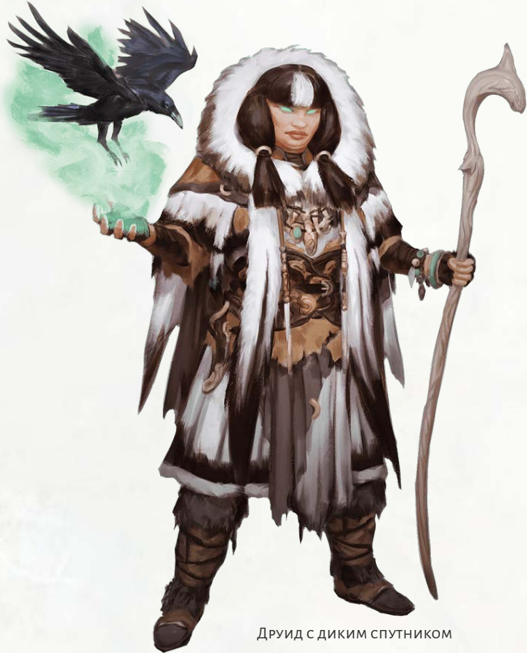
Друид с диким спутником