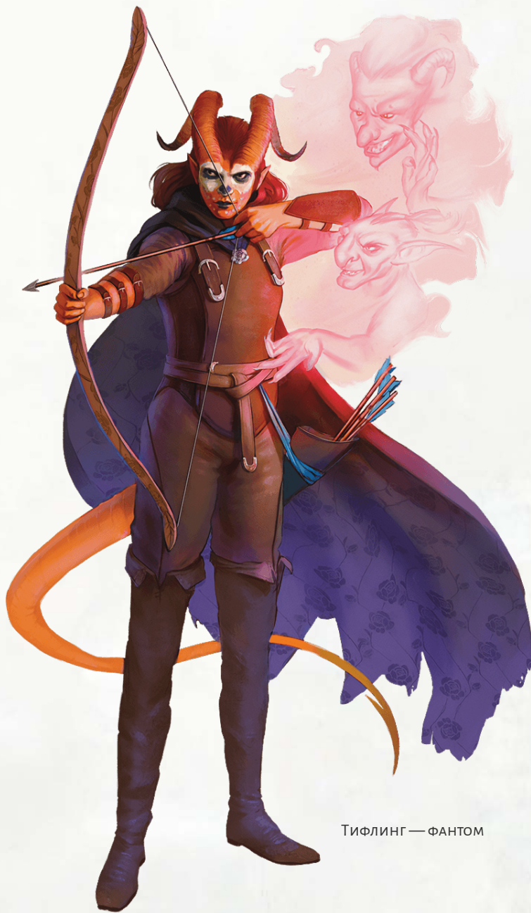
ТИФЛИНГ — ФАНТОМ

Вы остаетесь в этой форме 10 минут или до тех пор, пока не закончите её бонусным действием. Чтобы использовать это умение вновь, вы должны закончить продолжительный отдых или уничтожить одну из своих безделушек в качестве части бонусного действия для активации «Призрачной походки».