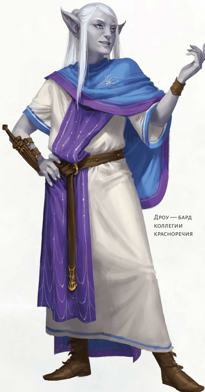
Дроу — БАРД КОЛЛЕГИИ КРАСНОРЕЧИЯ

Вместе с магией вы можете сплести слова, которые выбивают существо из колеи и заставляют его сомневаться в себе. Бонусным действием вы можете потратить одно использование «Вдохновения барда» и выбрать существо, которое вы можете видеть в пределах 60 футов от вас. Совершите бросок кости бардовского вдохновения. Существо должно выгест выпавший результат из следующего спасброска, который оно совершит до начала вашего следующего хода.