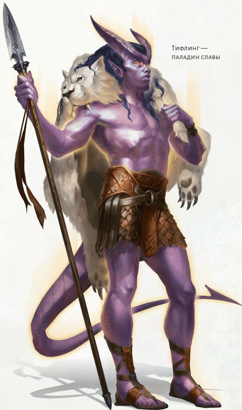
Тифлинг — ПАЛАДИН СЛАВЫ

Вы получаете доступ к заклинаниям клятвы согласно таблице «Заклинания клятвы славы». Как работают заклинания клятвы, сказано в «Книге игрока», в описании классового умения «Священная клятва».