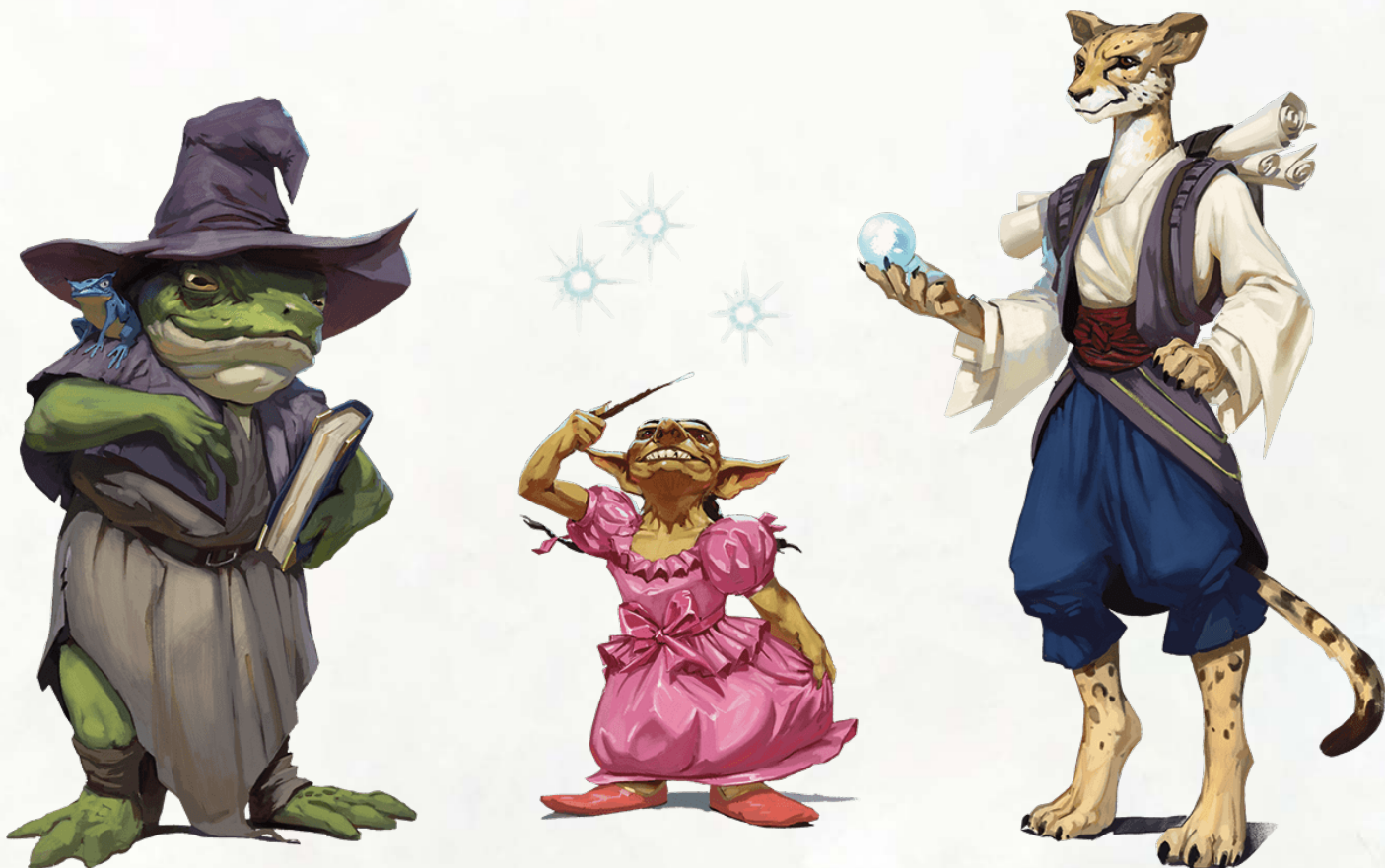
ЗАКЛИНАТЕЛИ СЛЕВА НАПРАВО: ЖАБОЛЮД, ГОБЛИН И ТАБАКСИ