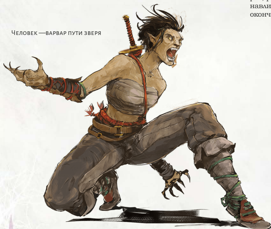
ЧЕЛОВЕК —ВАРВАР ПУТИ ЗВЕРЯ

Вы можете использовать это умение количество раз, равное вашему бонусу мастерства. Вы восстанавливаете все потраченные использования после окончания продолжительного отдыха.