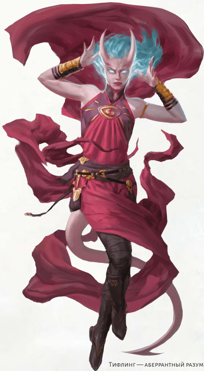
Тифлинг — АБЕРРАНТНЫЙ РАЗУМ