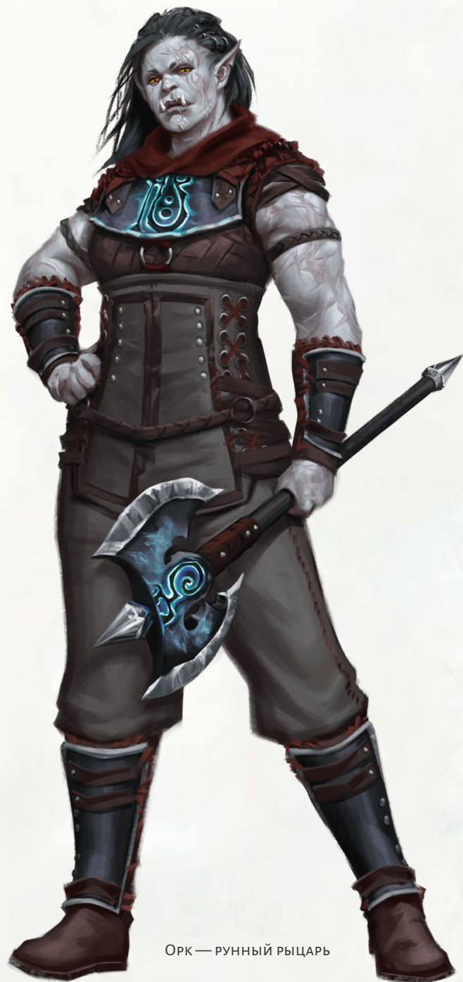
ОРК — РУННЫЙ РЫЦАРЬ

Магия ваших рун навсегда изменила вас. Когда вы получите это умение, бросьте 3к4. Вы становитесь