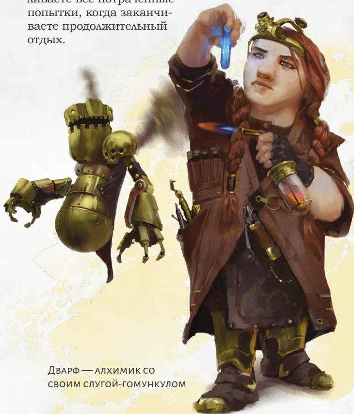
ДВАРФ — АЛХИМИК СО СВОИМ СЛУГОЙ-ГОМУНКУЛОМ

Вы можете использовать это умение количество раз, равное вашему модификатору Интеллекта (минимум один), и восстанавливаете все потраченные попытки, когда заканчиваете продолжительный отдых.