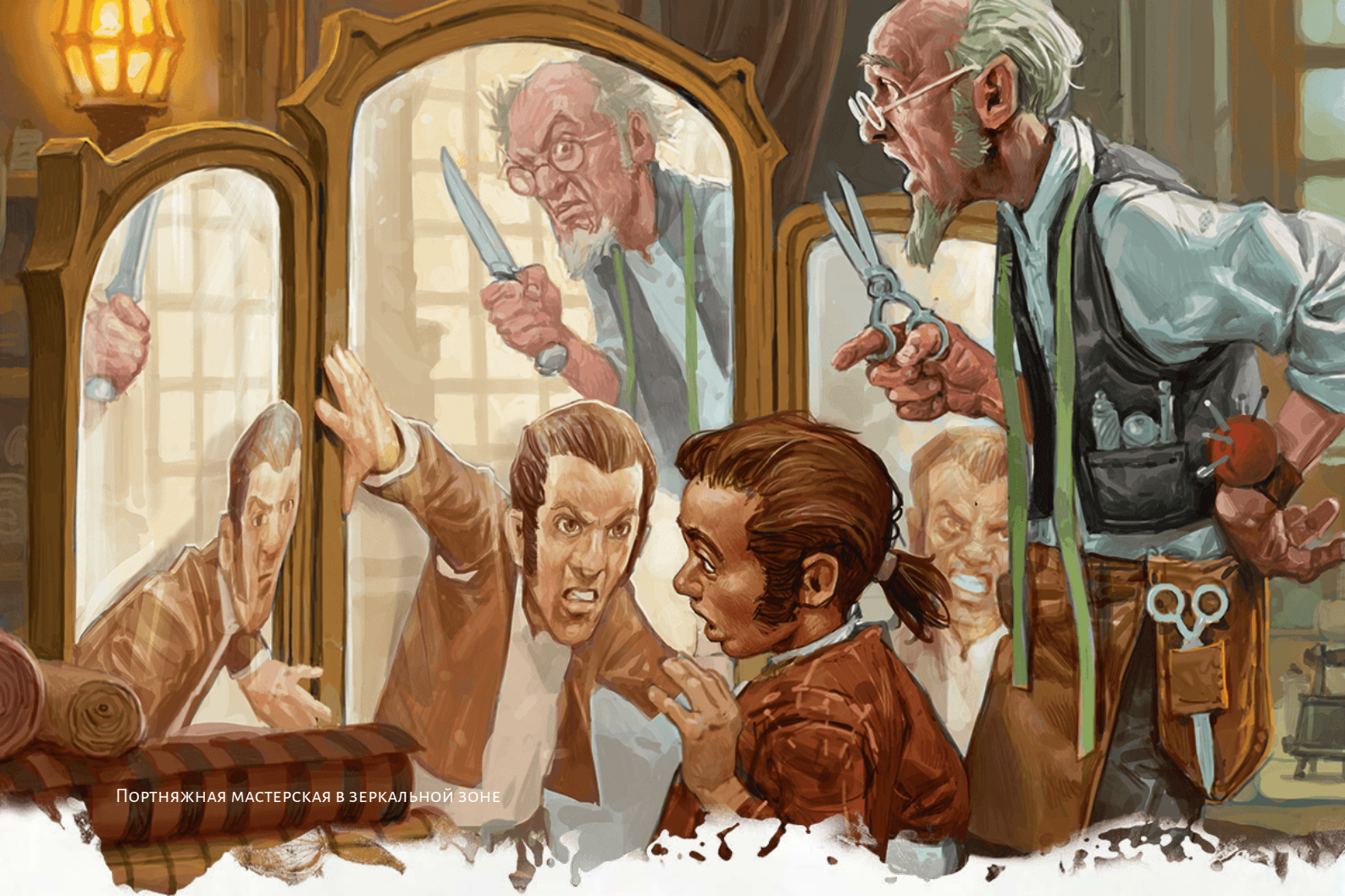
ПОРТНЯЖНАЯ МАСТЕРСКАЯ В ЗЕРКАЛЬНОЙ ЗОНЕ