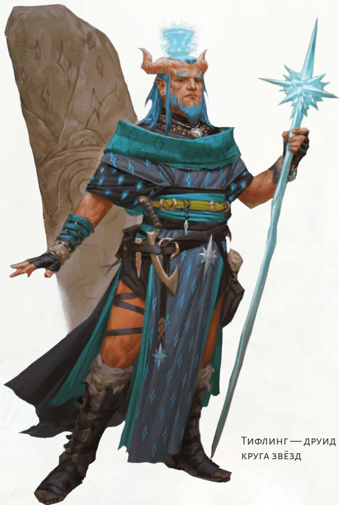
Тифлинг — друид КРУГА ЗВЁЗД