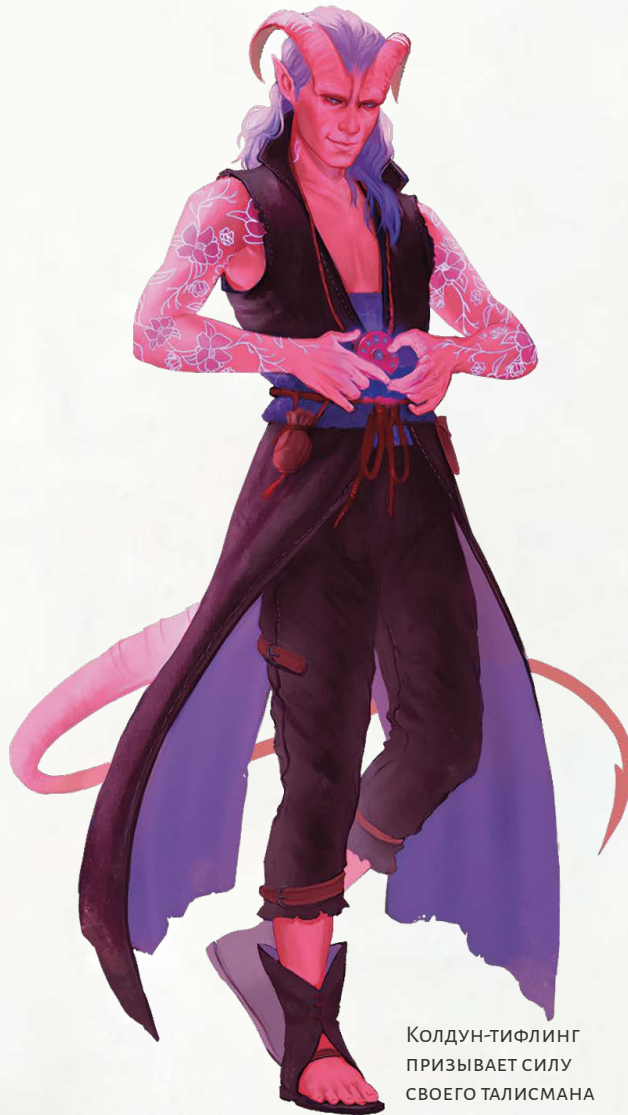
Колдун-тифлинг ПРИЗЫВАЕТ СИЛУ СВОЕГО ТАЛИСМАНА

Действием вы можете магическим образом удалить имя со страницы, просто коснувшись его.