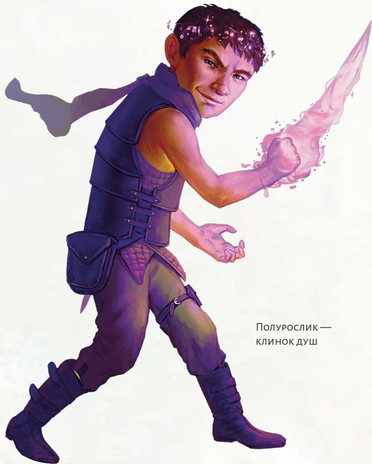
Полурослик — клинок душ

себе псионическую силу и используют её в своей плутовской работе. Они легко находят работу в воровских гильдиях, хотя им часто не доверяют те плуты, которые подозрительно относятся к любому, кто использует странные ментальные способности для ведения своих дел. Большинство правителей были бы счастливы нанять клинка душ в качестве шпиона.