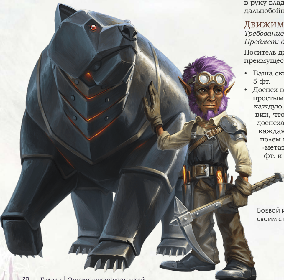
БОЕВОЙ КУЗНЕЦ — ГНОМ ВМЕСТЕ СО СВОИМ СТАЛЬНЫМ ЗАЩИТНИКОМ