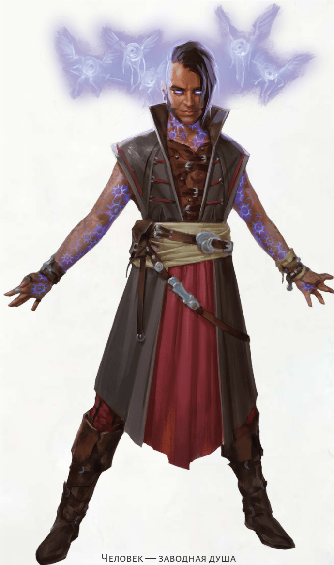
ЧЕЛОВЕК — ЗАВОДНАЯ ДУША

Когда вы используете бонусное действие подобным образом, вы не сможете сделать это вновь, пока не закончите продолжительный отдых или не потратите 5 единиц чародейства на повторное использование этого умения.