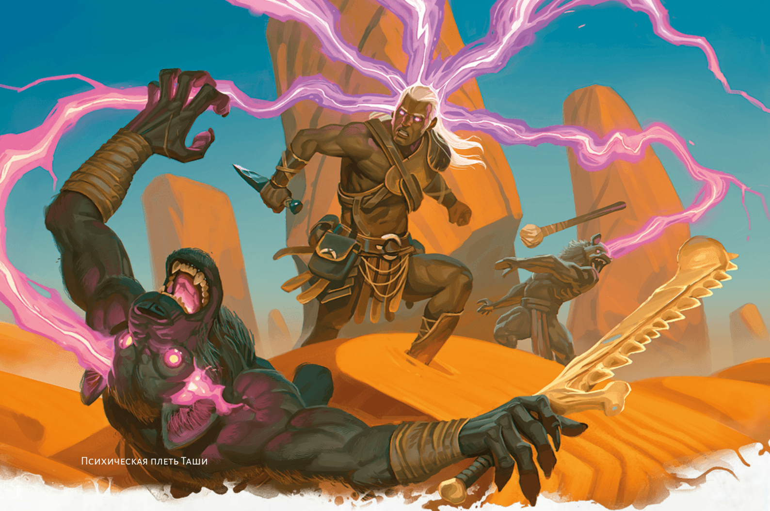
Психическая плеть Таши

ход: передвигаться, совершать действие или бонусное действие — цель может совершить лишь что-то одно. При успехе цель получает половину урона и избегает других эффектов заклинания.