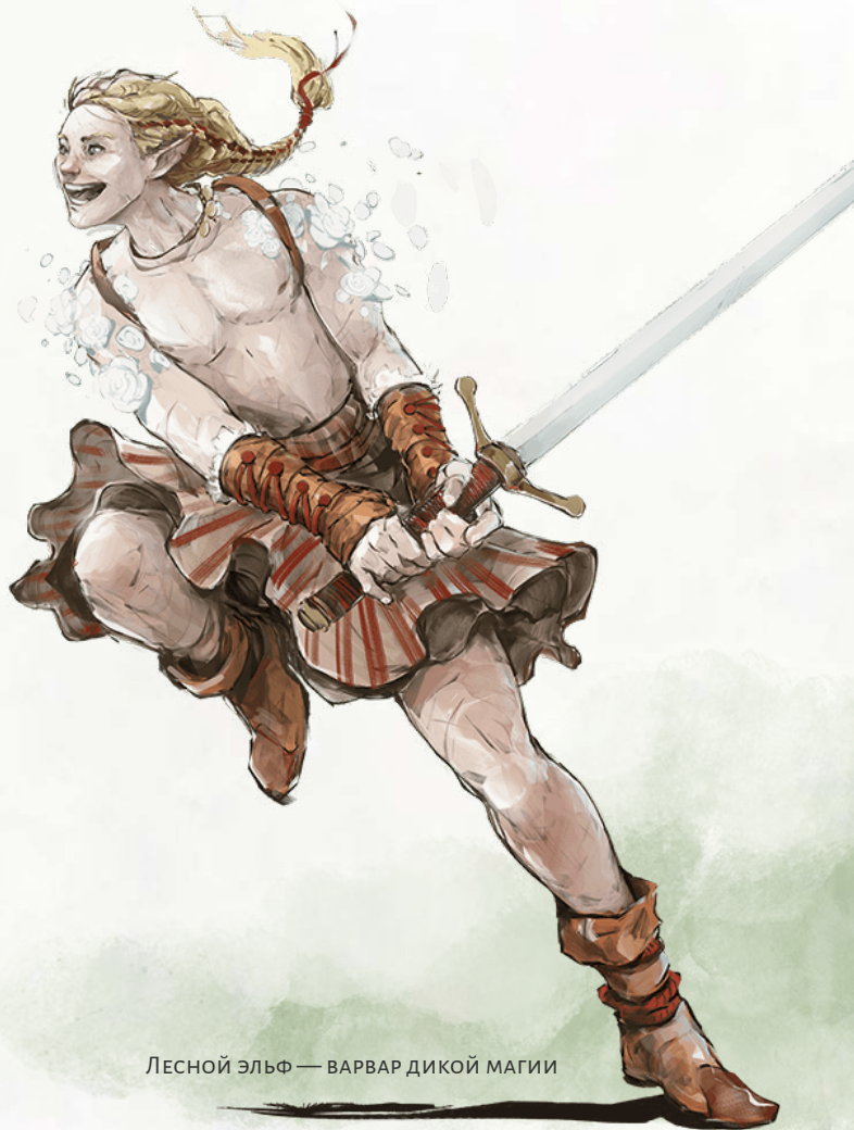
ЛЕСНОЙ ЭЛЬФ — ВАРВАР ДИКОЙ МАГИИ

Многие места в мультивселенной изобилуют красотой, сильными эмоциями и необузданной магией. Страна Фей, Верхние Планы и другие сверхъестественные области излучают такие силы и могут глубоко влиять на существ. Как существа с развитыми чувствами, варвары особенно восприимчивы к этому дикому влиянию, а некоторые из них даже трансформируются под влиянием этой магии. Эти пропитанные магией варвары идут по пути дикой магии. Эльфы, тифлинги, аасимары и дженази часто ищут этот путь дикости, стремясь проявить потустороннюю магию своих предков.