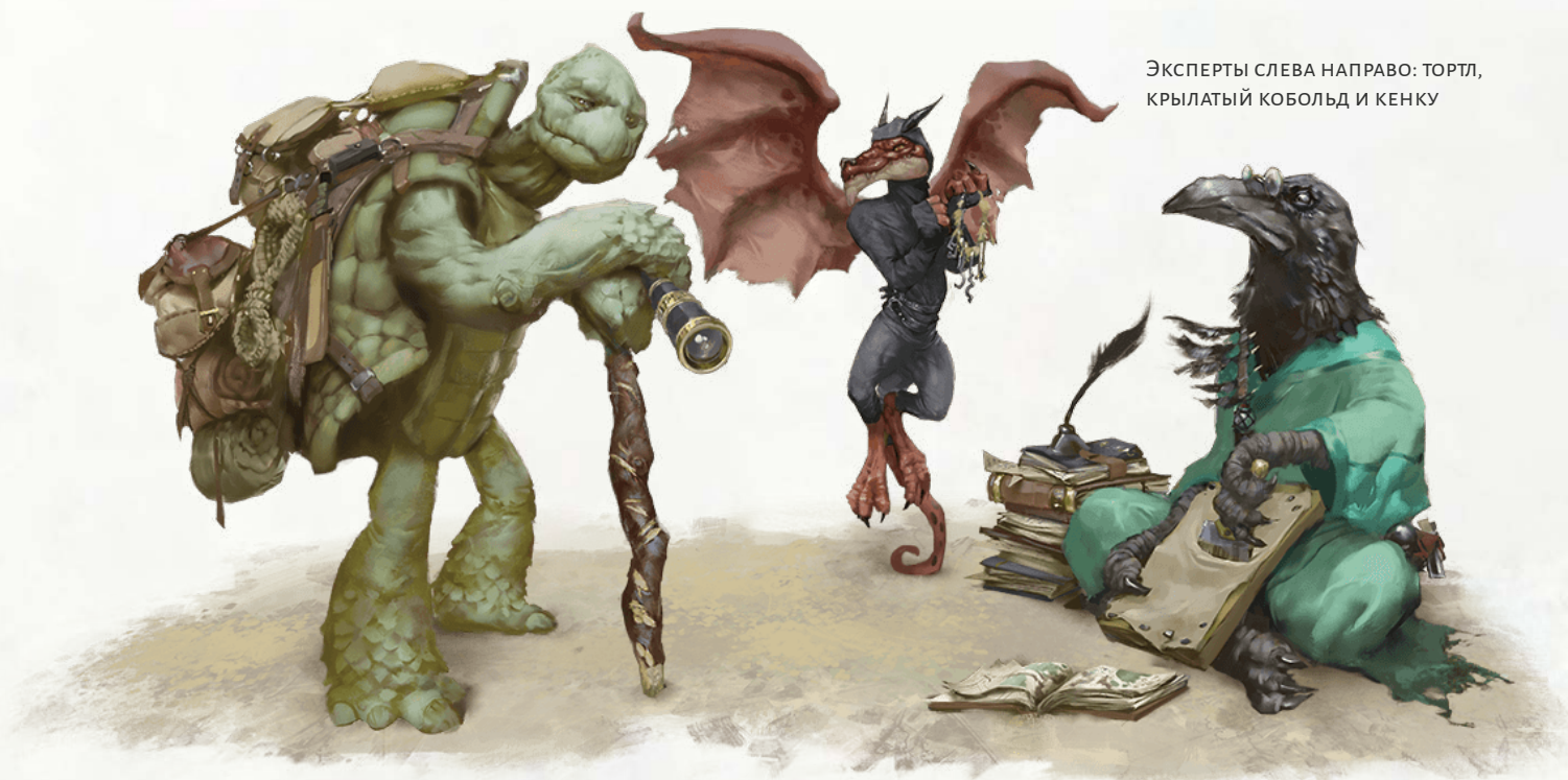
ЭКСПЕРТЫ СЛЕВА НАПРАВО: ТОРТЛ, КРЫЛАТЫЙ КОБОЛЬД И КЕНКУ