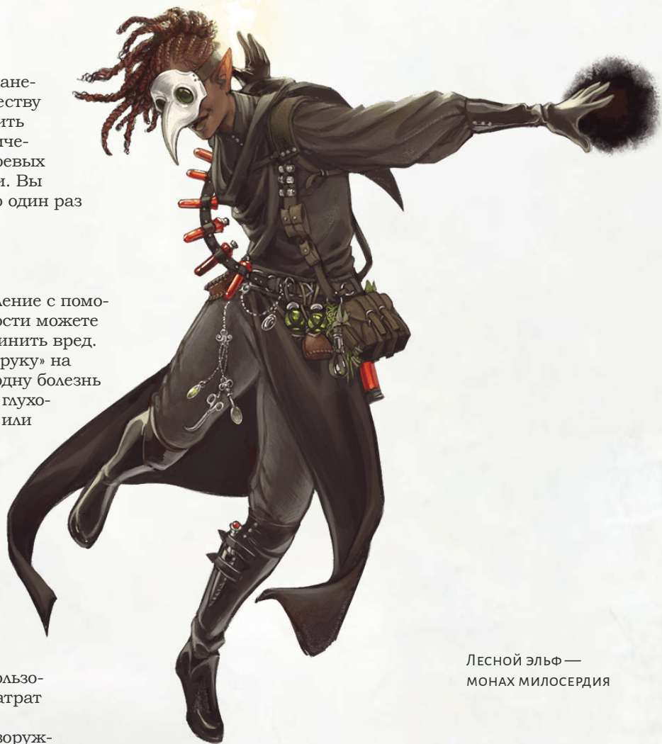
Лесной эльф — монах милосердия

Используя это умение, вы не сможете использовать его повторно, пока не закончите продолжительный отдых.