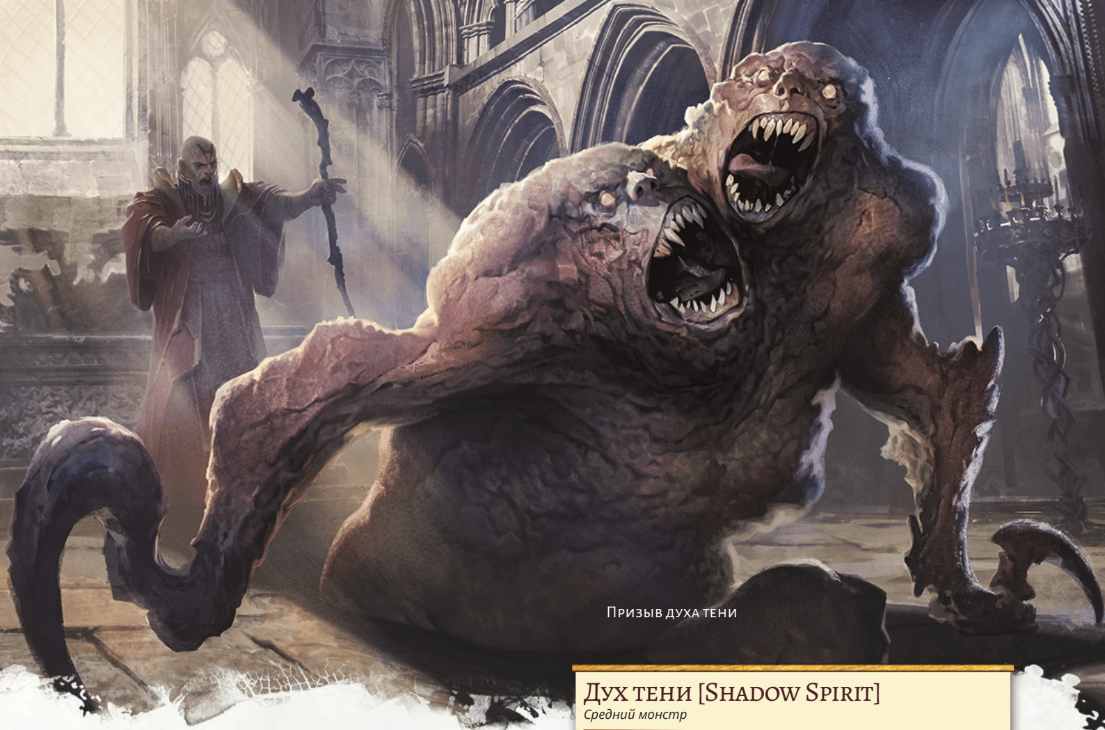
ПРИЗЫВ ДУХА ТЕНИ

исчезает, когда его хиты опускаются до 0 или когда заклинание заканчивается.