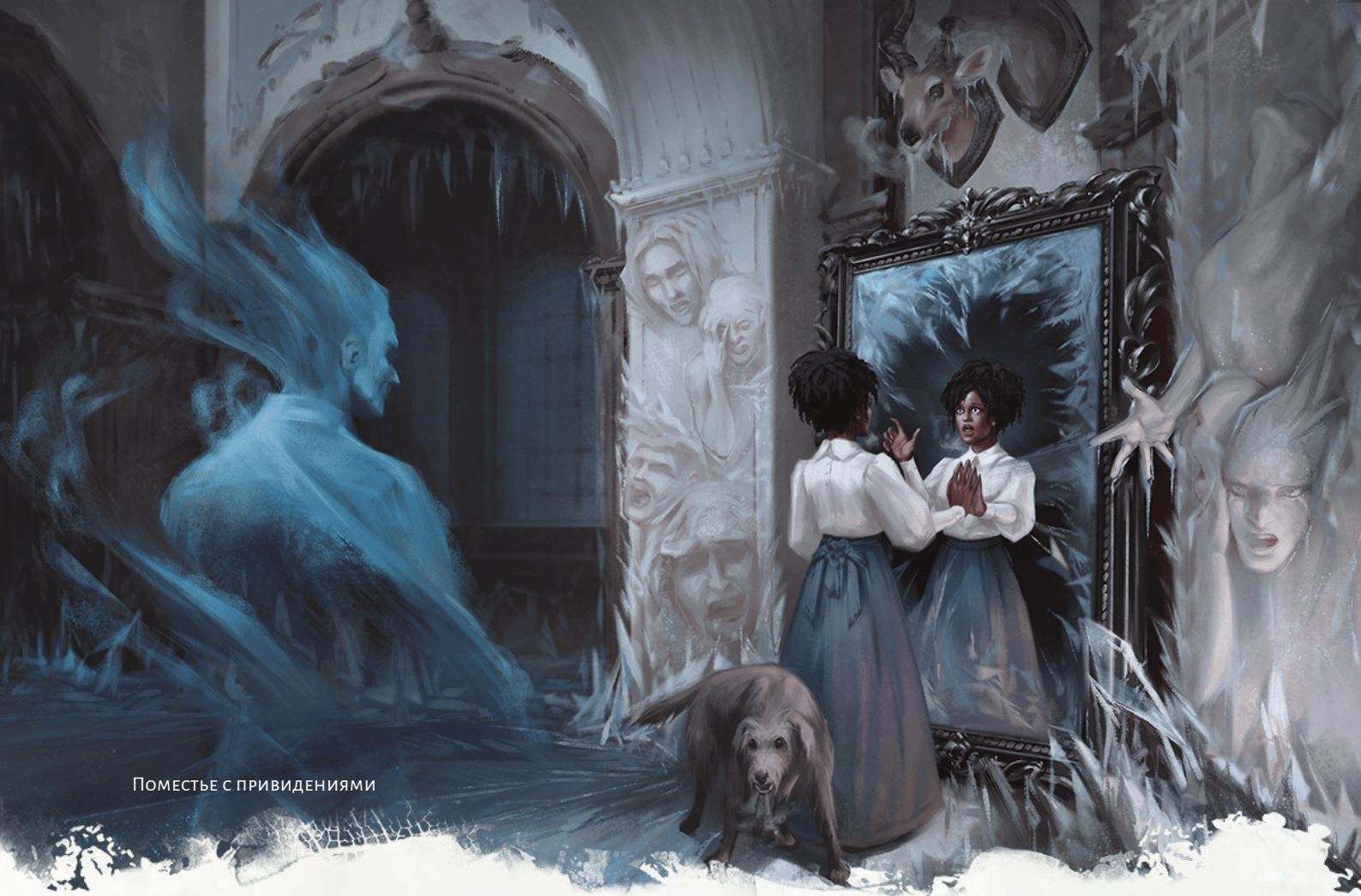
Поместье с привидениями