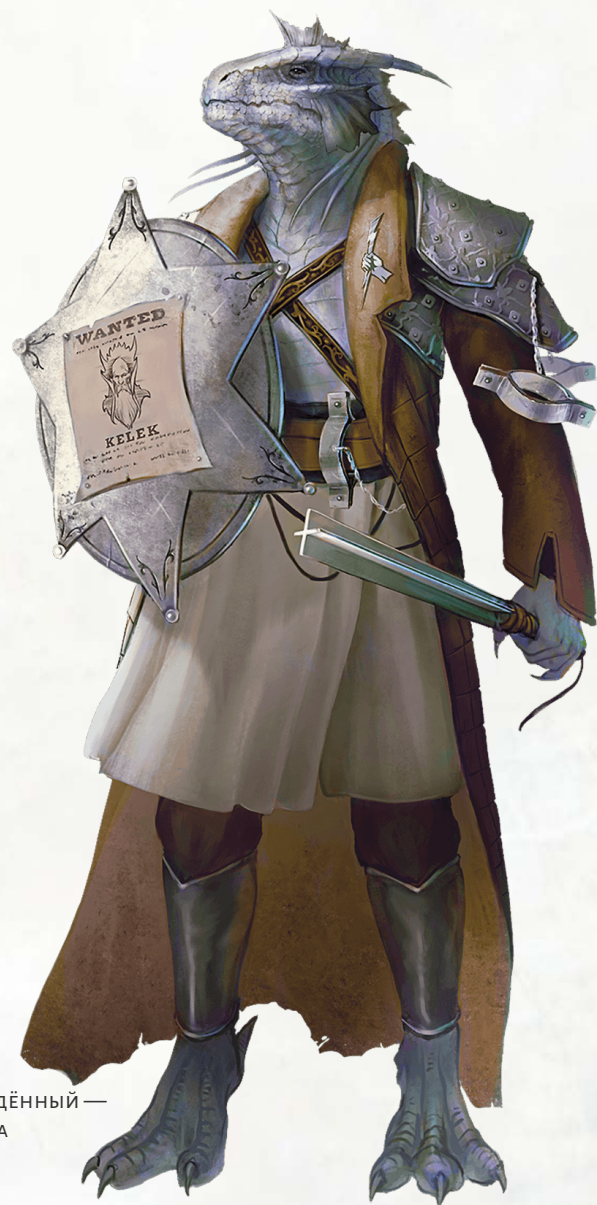
Драконорождённый — жрец порядка

Вы можете использовать это умение количество раз, равное вашему модификатору Мудрости (минимум 1 раз). Вы восстанавливаете все потраченные использования после окончания продолжительного отдыха.