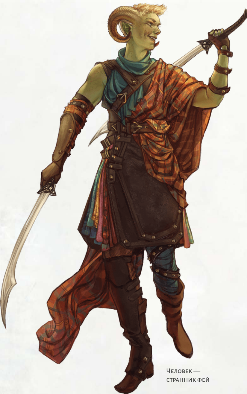
ЧЕЛОВЕК — СТРАННИК ФЕЙ