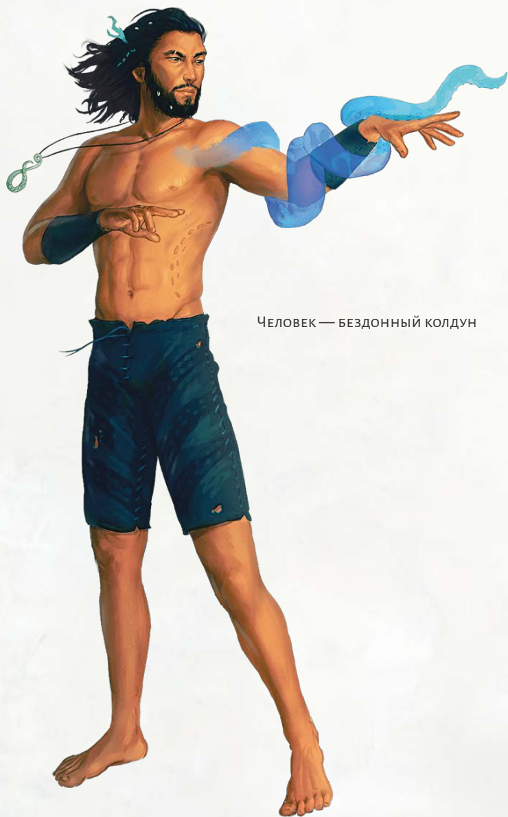
ЧЕЛОВЕК — БЕЗДОННЫЙ КОЛДУН