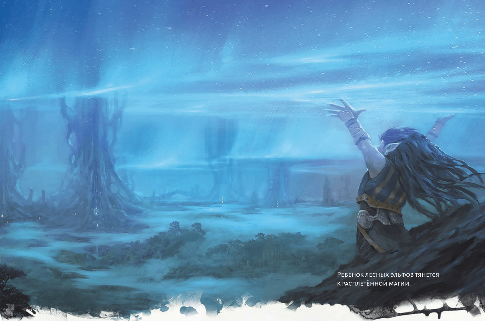
РЕБЕНОК ЛЕСНЫХ ЭЛЬФОВ тянется к расплётённой магии.