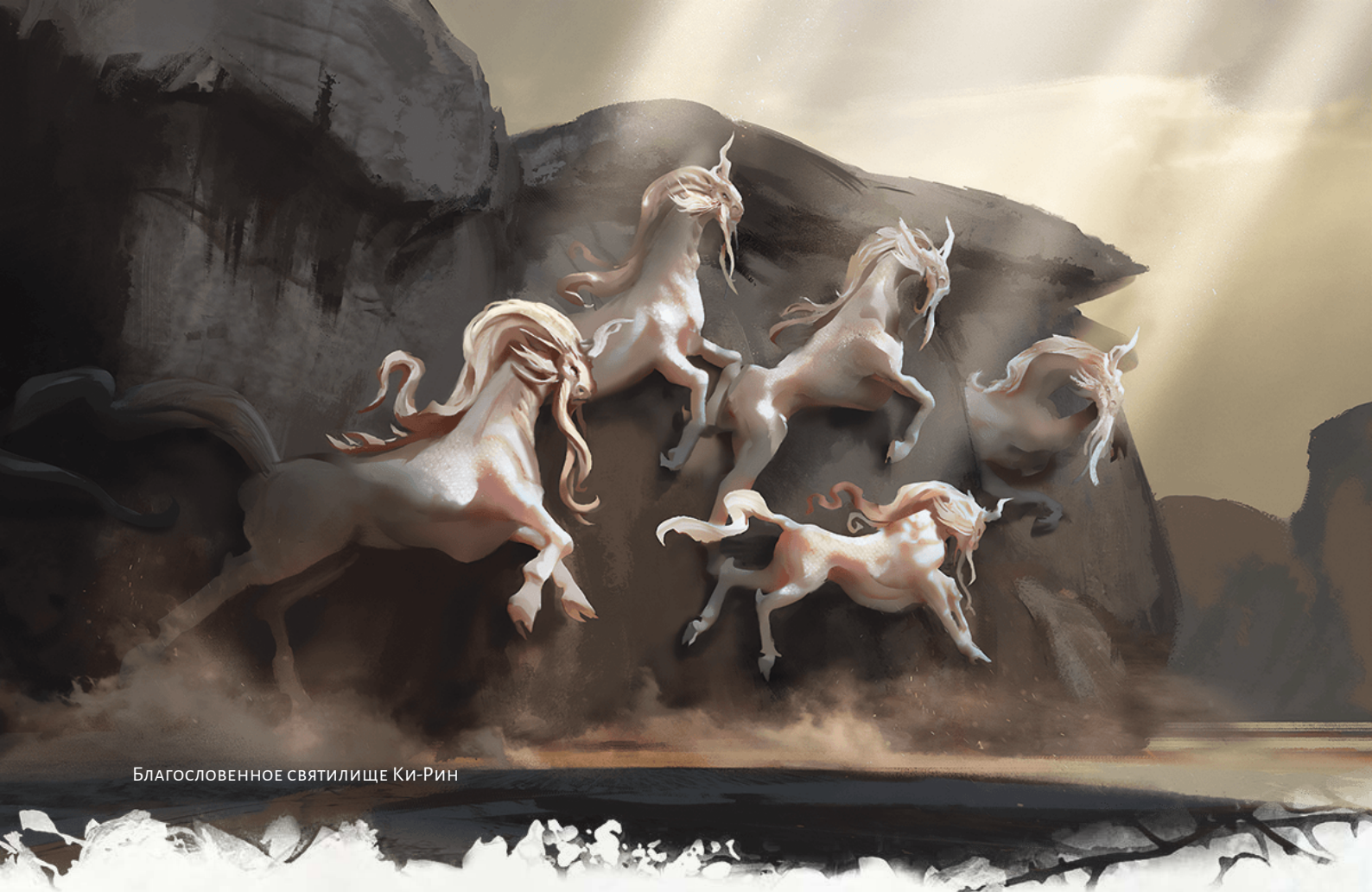
Благословенное святилище Ки-Рин