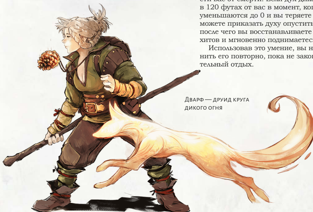
ДВАРФ — ДРУИД КРУГА ДИКОГО ОГНЯ

Вы получаете способность обращать смерть в магическое пламя, способное как исцелять, так и сжигать. Когда в пределах 30 футов от вас или вашего духа умирает существо размером не меньше Маленького, в пространстве мёртвого существа возникает безвредное пламя и мерцает там в течение 1 минуты. Когда существо, которое вы можете видеть, входит в пространство этого пламени, вы можете реакцией погасить призрачный огонёк, после чего вы восстанавливаете вошедшему существу