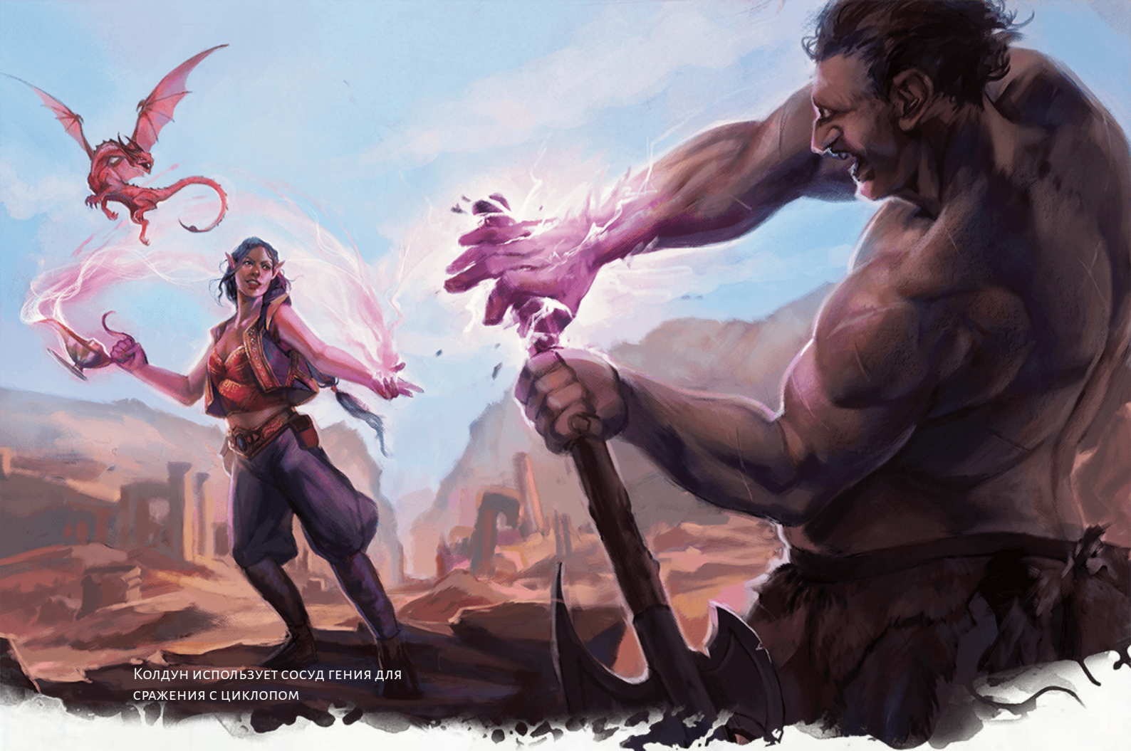
Колдун использует сосуд гения для сражения с циклопом