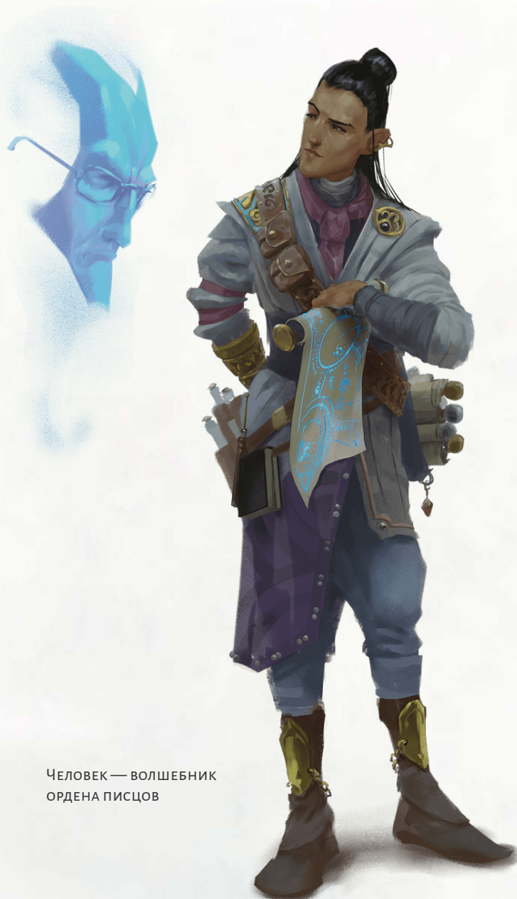
ЧЕЛОВЕК — ВОЛШЕБНИК ОРДЕНА ПИСЦОВ