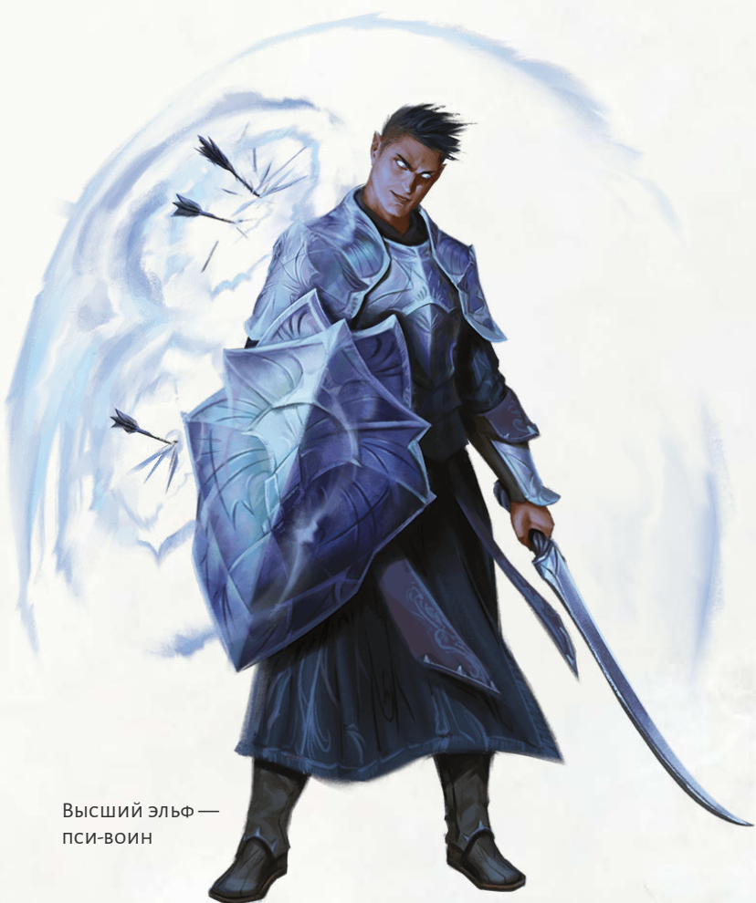
Высший эльф — пси-воин

Телекинетический толчок. Когда вы наносите урон при помощи псионического удара, вы