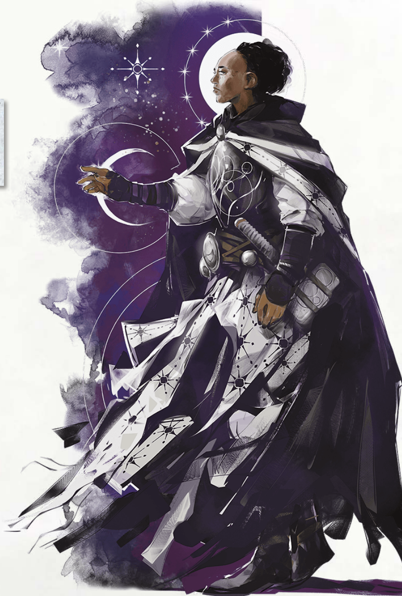
ЧЕЛОВЕК — ЖРЕЦ СУМЕРЕК

Вы получаете владение воинским оружием и тяжелой броней.