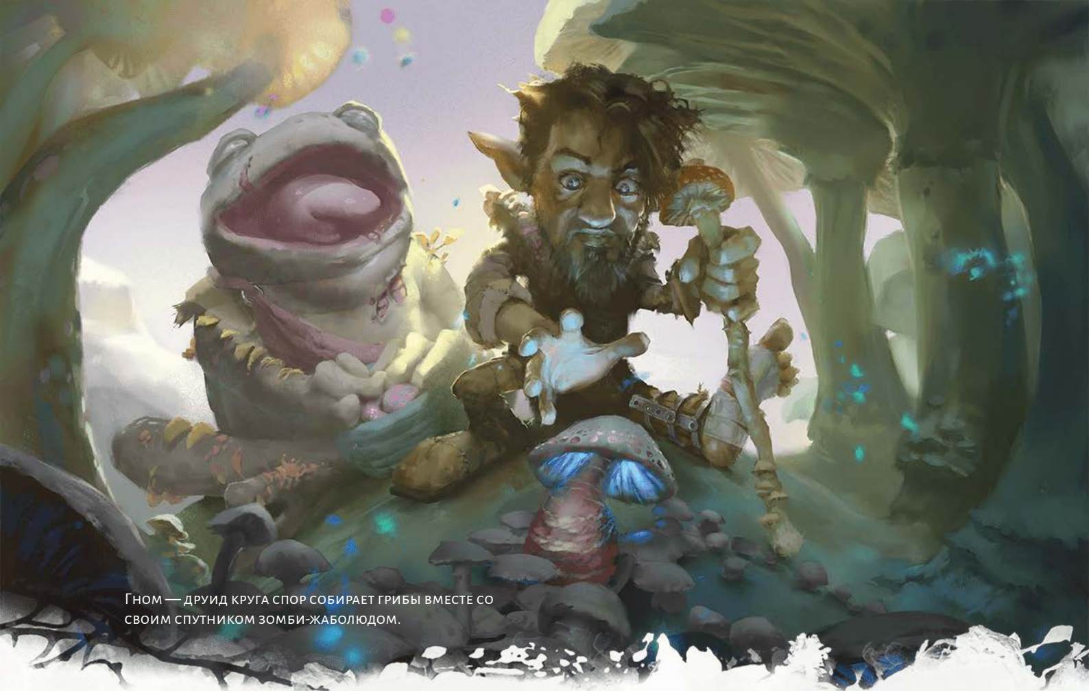
ГНОМ — ДРУИД КРУГА СПОР СОБИРАЕТ ГРИБЫ ВМЕСТЕ СО СВОИМ СПУТНИКОМ ЗОМБИ-ЖАБОЛЮДОМ.

выпадении на к20 результата «1–9» считать, что выпало «10».