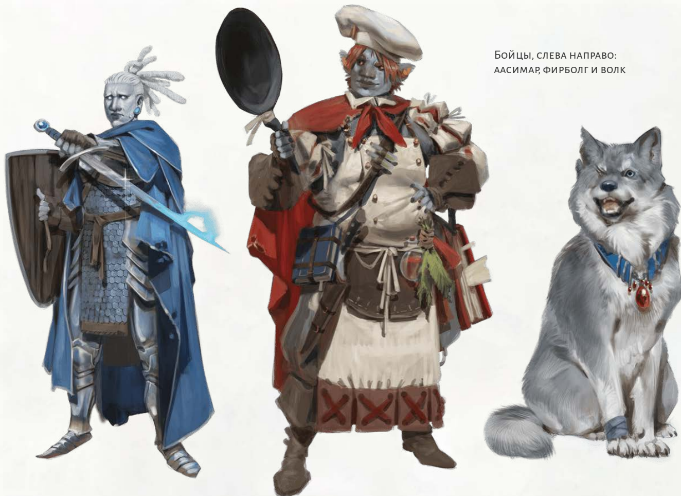
Бойцы, слева направо: ААСИМАР, ФИРБОЛГ И ВОЛК