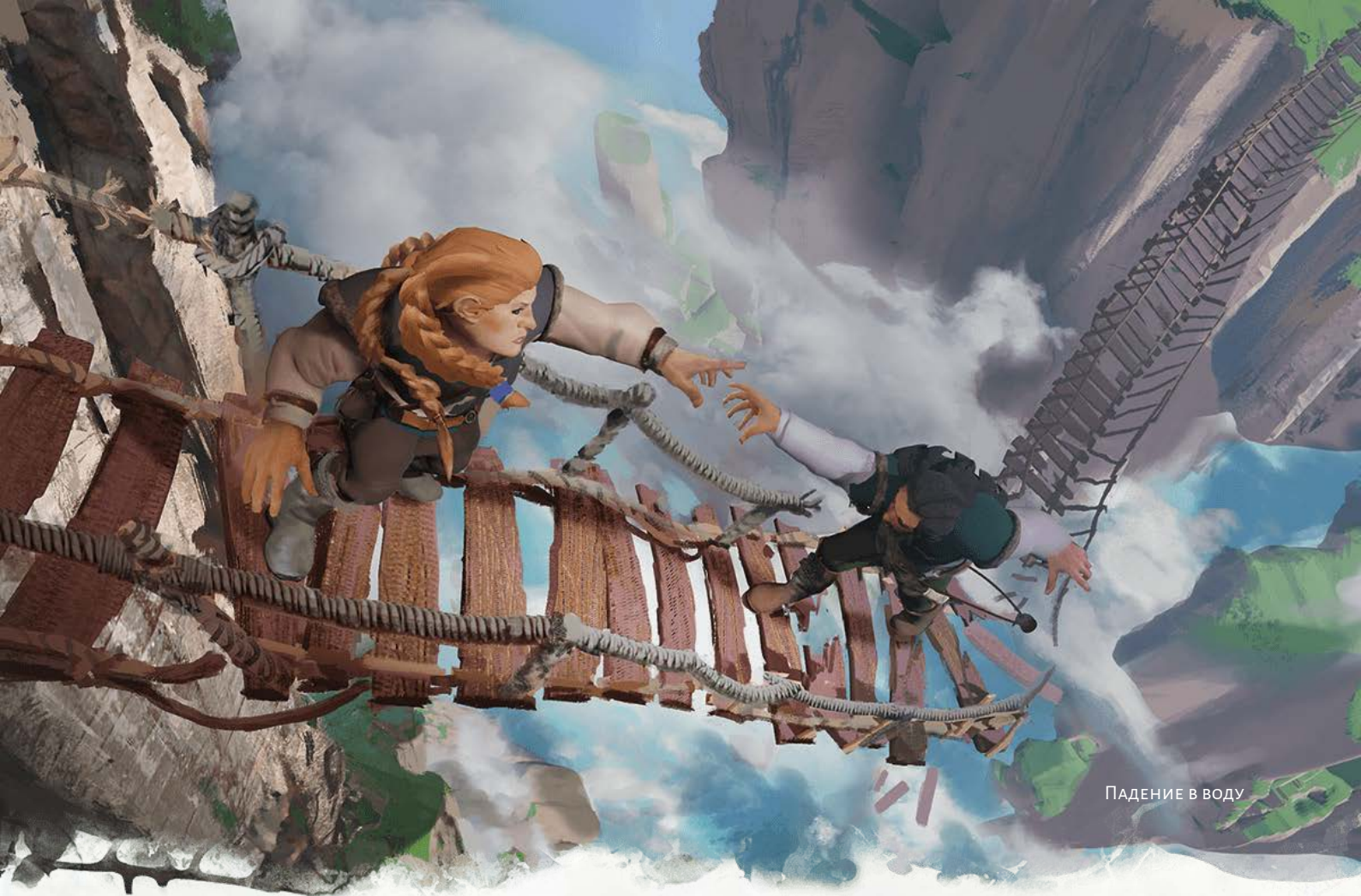
ПАДЕНИЕ В ВОДУ