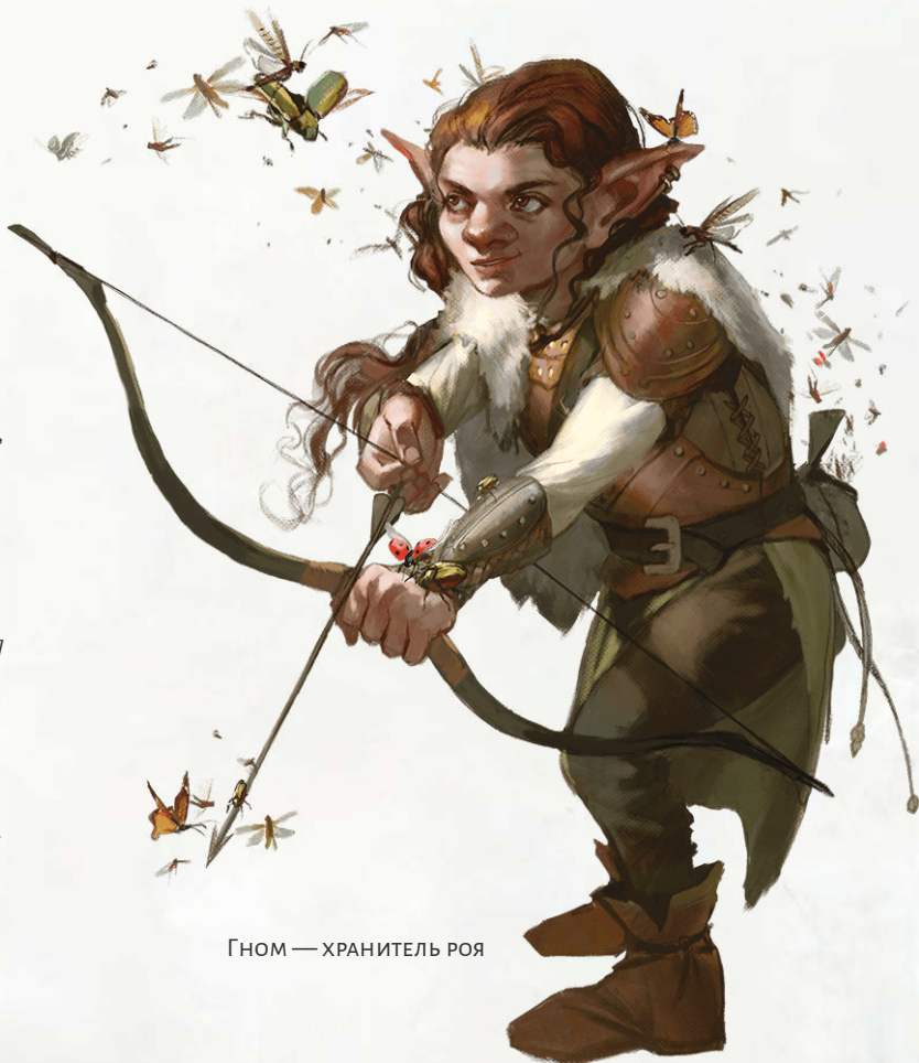
ГНОМ — ХРАНИТЕЛЬ РОЯ

Ощущая глубокую связь с окружающим миром, некоторые следопыты используют свои магические связи, чтобы прикоснуться к природе и связывать себя с роем природных духов. Этот рой становится серьёзной силой в бою, а также полезной компанией следопыту. Некоторые хранители роя счита-