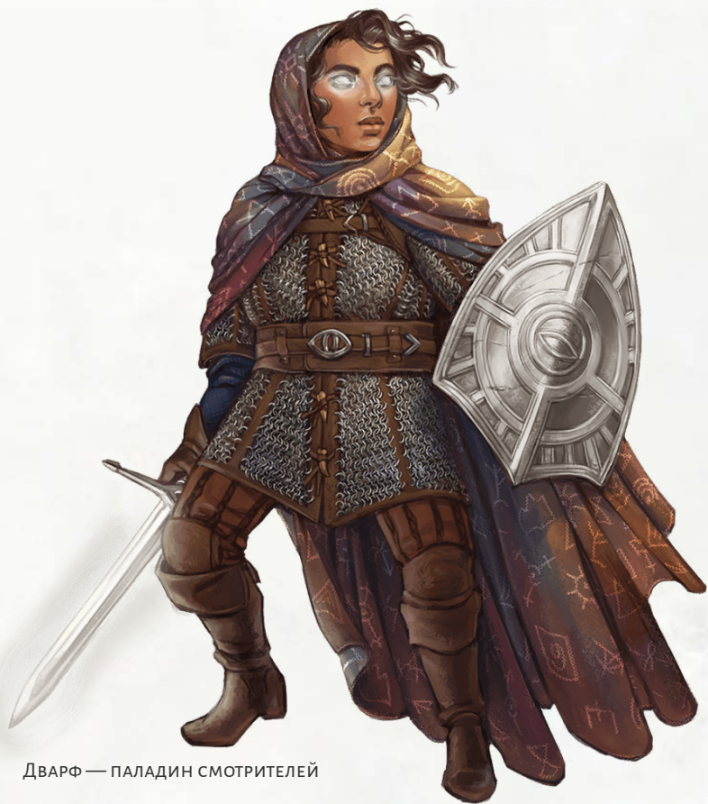
ДВАРФ — ПАЛАДИН СМОТРИТЕЛЕЙ

Вы научились магическим образом наказывать любого, кто посмеет использовать чары против вас или ваших товарищей. Каждый раз, когда вы или существо, которое вы можете видеть в пределах 30 футов, преуспевает в спасброске Интеллекта, Мудрости или Харизмы, вы можете реакцией нанести 2к8 + ваш модификатор Харизмы урона силовым полем тому, кто заставил совершить этот спасбросок.