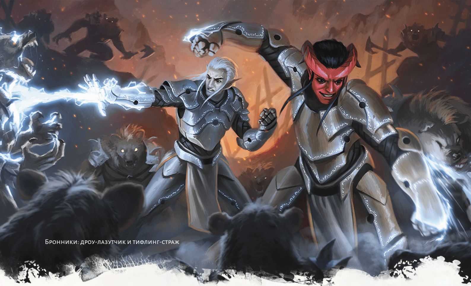
Бронники: дроу-лазутчик и тифлинг-страж