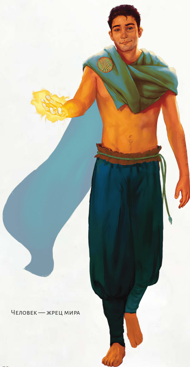
ЧЕЛОВЕК — ЖРЕЦ МИРА