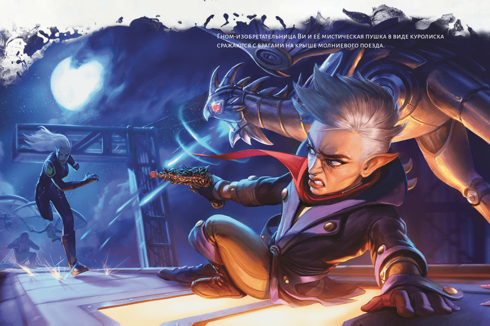
Гном-изобретательница Ви и её мистическая пушка в виде куролиска сражаются с врагами на крыше молниевоза.

Чтобы создать изобретателя, обратитесь к следующим подразделам, которые дают вам хиты, навыки и начальное снаряжение. Затем посмотрите в таблицу «Изобретатель», чтобы узнать, какие умения вы получаете на каждом уровне. Описания этих умений приведены в разделе «Классовые умения» ниже.